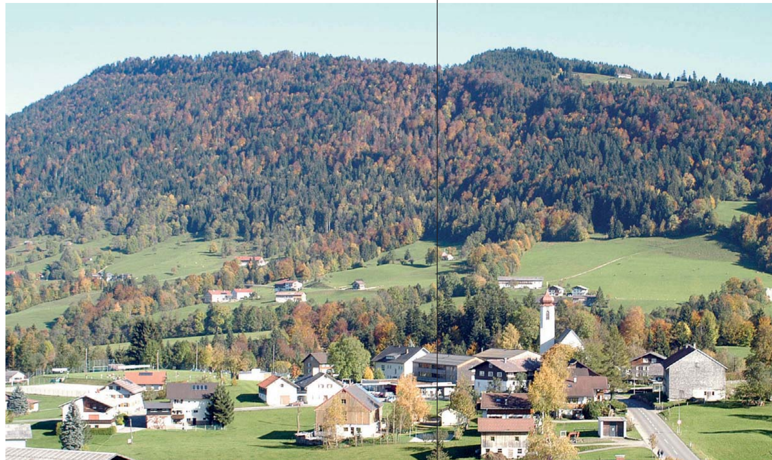
Krumbach in the Bregenzerwald